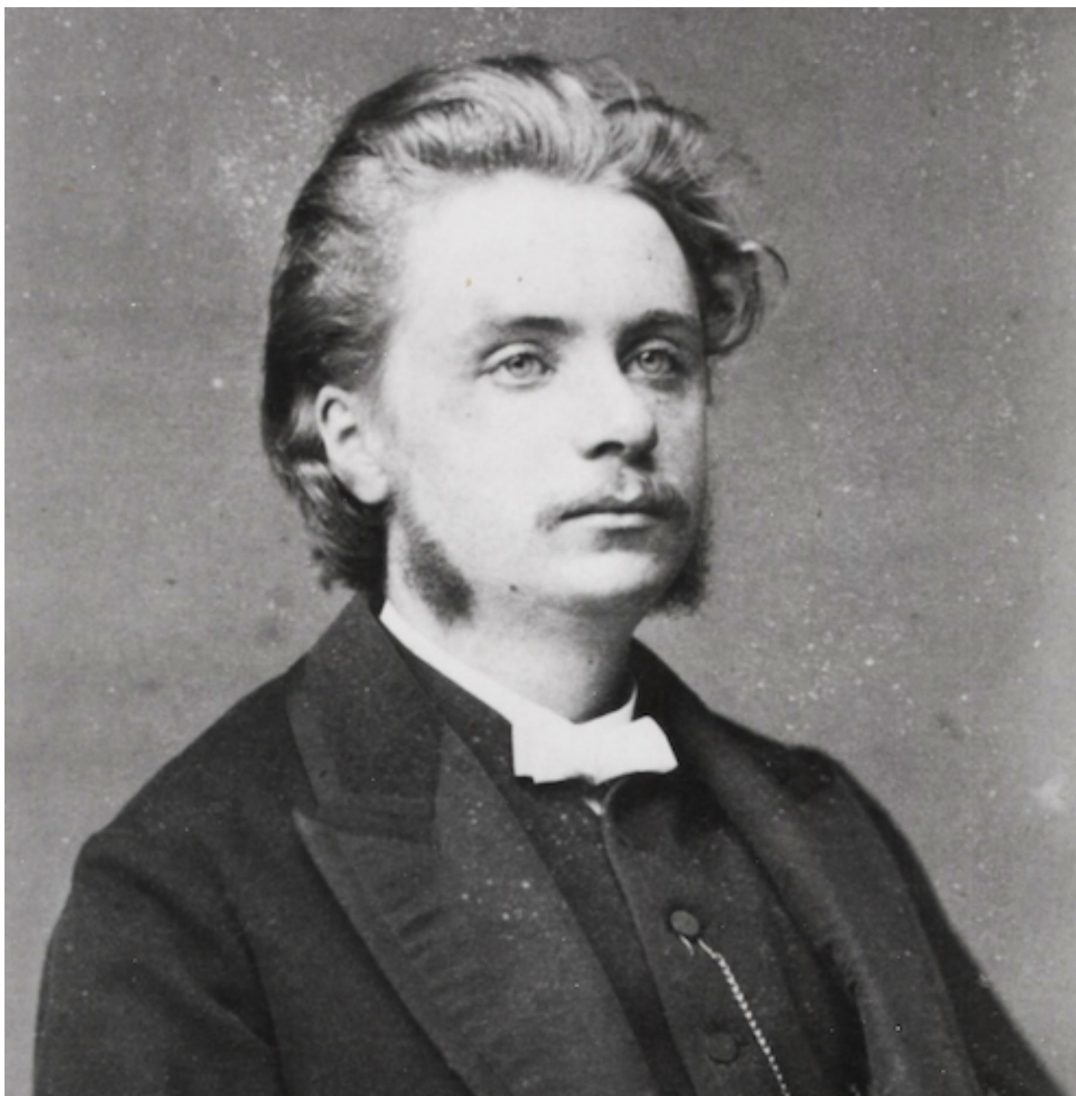
Edvard Grieg em 1886 | Fonte: Wikimedia Commons