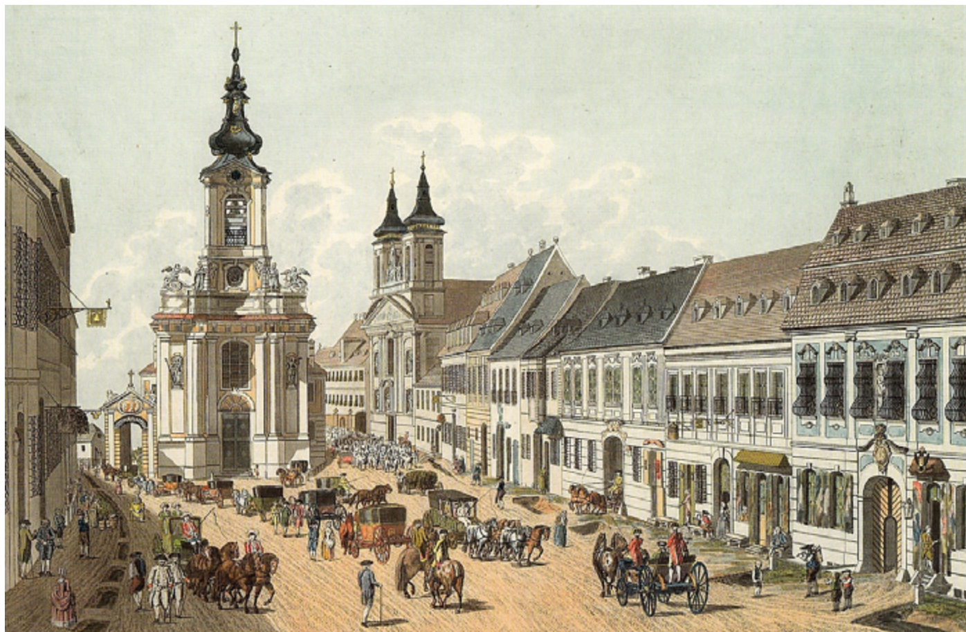
A Cidade de Viena em 1783 | Pintura de Johann Ziegler