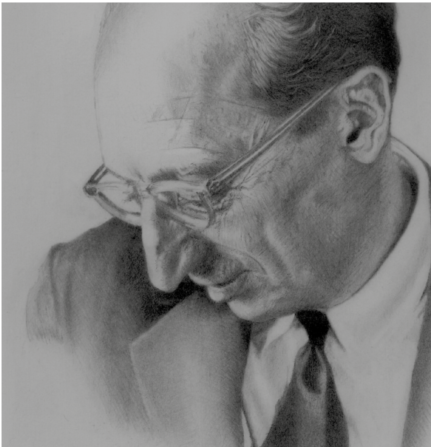
Aaaron Copland | desenho de Richard Hurd a partir de fotografia