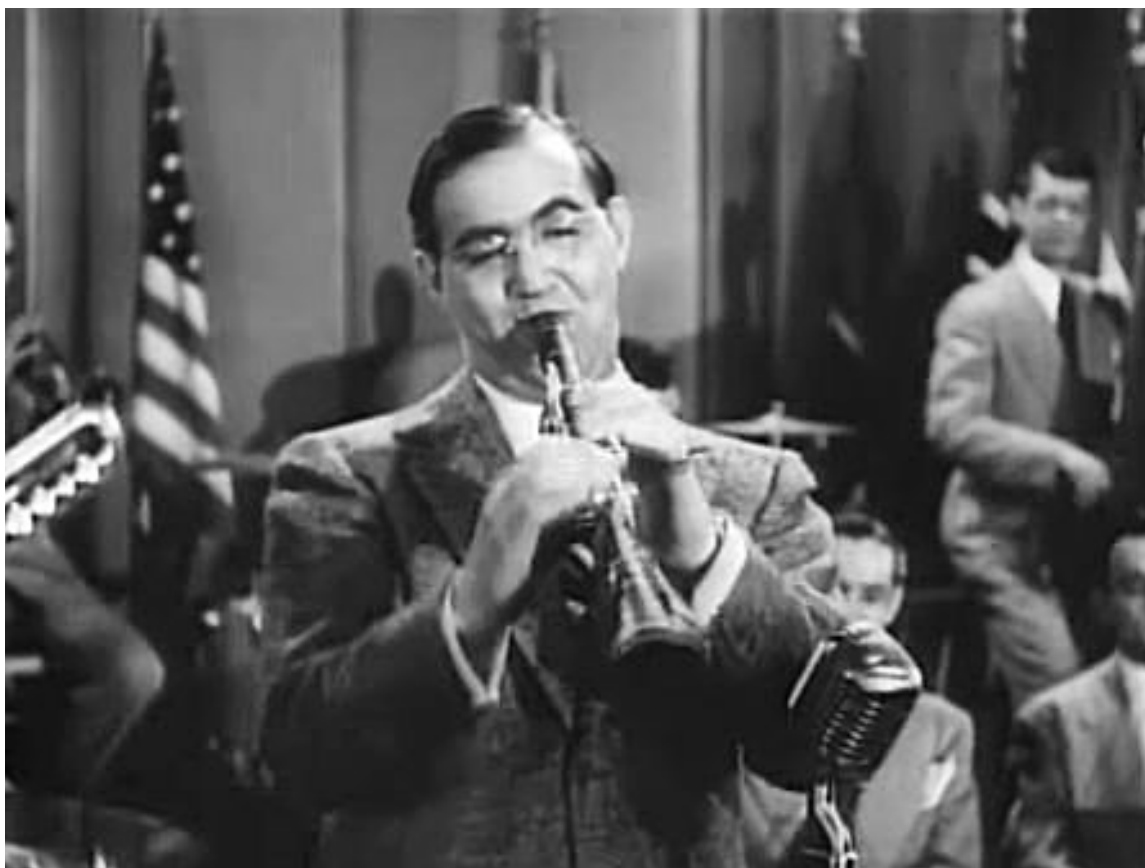
Benny Goodman no filme Stage Door Canteen (1943)

obra que seria estreada em novembro de 1950. Em virtude do solista a quem se destinava, não espanta, portanto, que sobressaíam sonoridades jazzísticas e alusões à música popular, ainda que de maneira muito discreta, sobretudo no primeiro andamento, uma valsa lenta de cariz melancólico. Vislumbra-se, ainda, nalguns momentos, ritmos de cariz brasileiro, o que se terá devido a circunstância de parte da obra ter sido composta durante uma digressão do compositor à América do Sul. Copland optou então por escrever para um dispositivo orquestral que junta às cordas somente uma harpa e um piano. Na vez dos expectáveis três andamentos de matriz clássica, apresenta somente dois, com uma cadenza pelo meio que, para lá de evidenciar as capacidades artísticas do solista, introduz os temas que são explorados de modo mais efusivo no segundo andamento que se segue. Por fim, destaca-se uma nota de bom humor, talvez um gesto de homenagem. Nos derradeiros compassos, ouve-se um motivo ascendente no clarinete que recorda o emblemático início de Rhapsody in Blue de Gershwin.