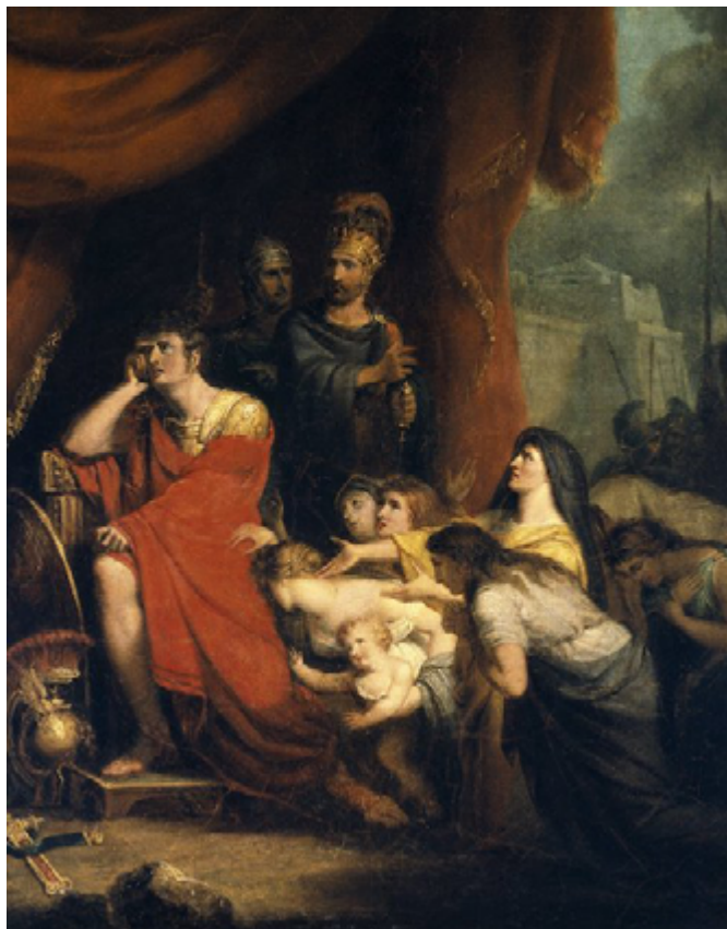
«Volumnia implora a Coriolano» / Pintura de Richard Westall / 1800